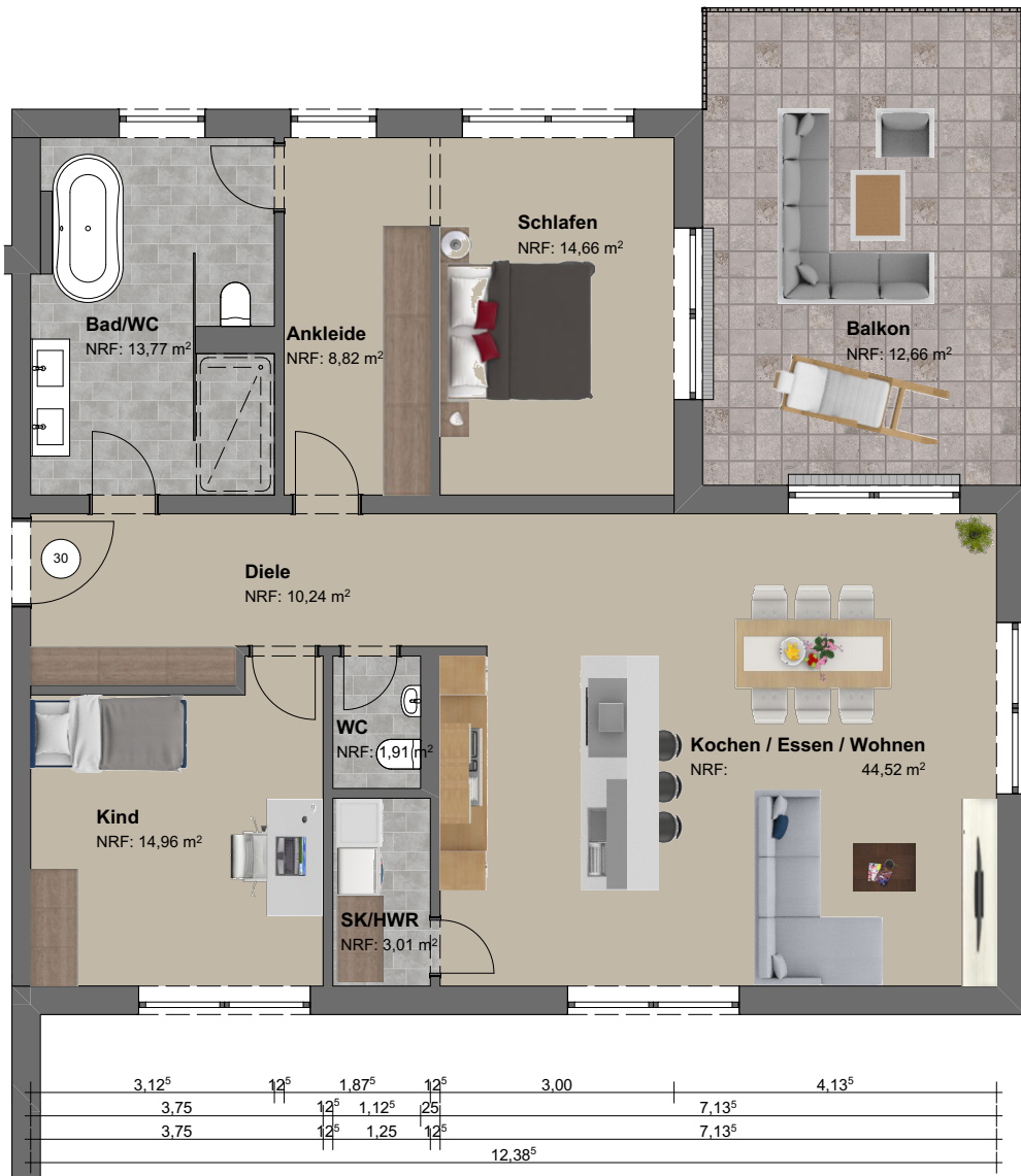
Grundriss | M 1:100