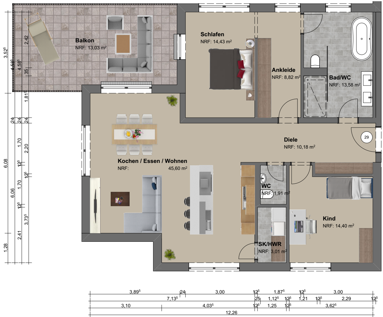
Grundriss | M 1:100