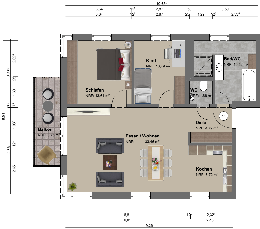
Grundriss | M 1:100