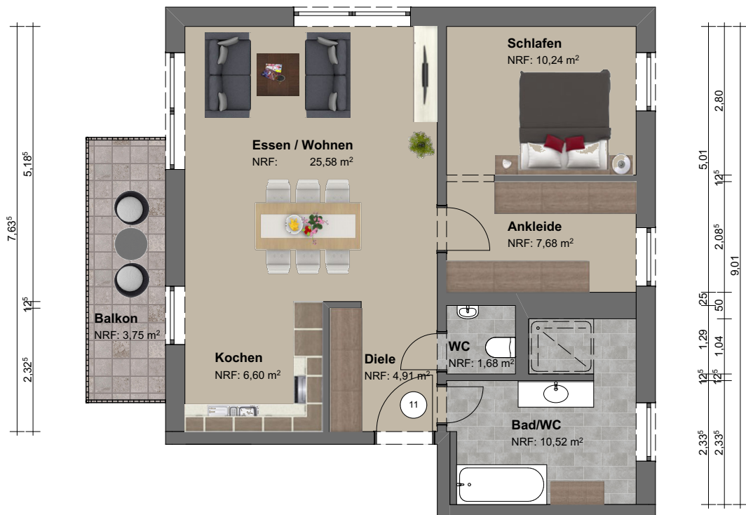
Grundriss | M 1:100