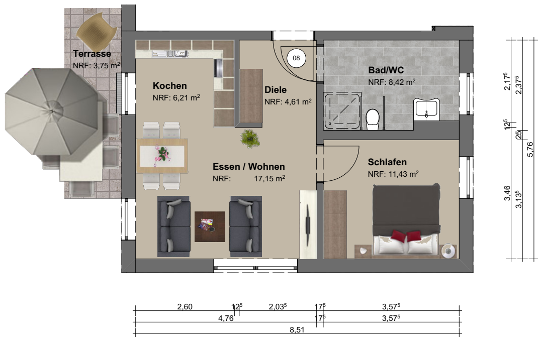
Grundriss | M 1:100