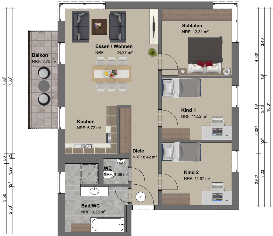
Grundriss | M 1:100