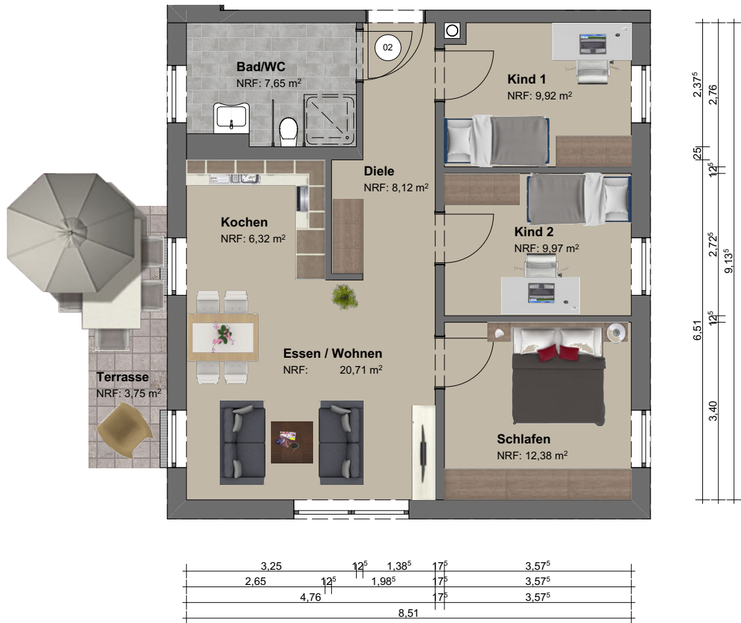
Grundriss | M 1:100