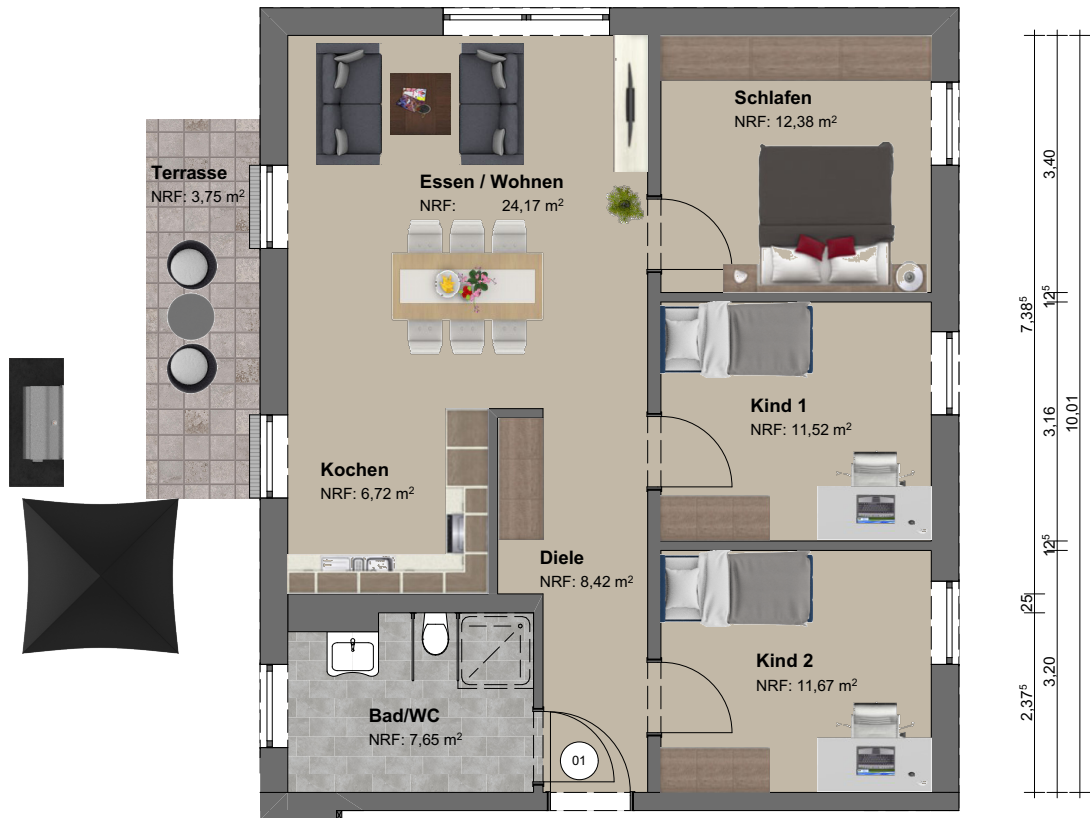
Grundriss | M 1:100